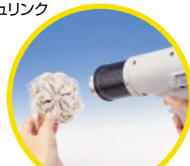
シュリンクパック例